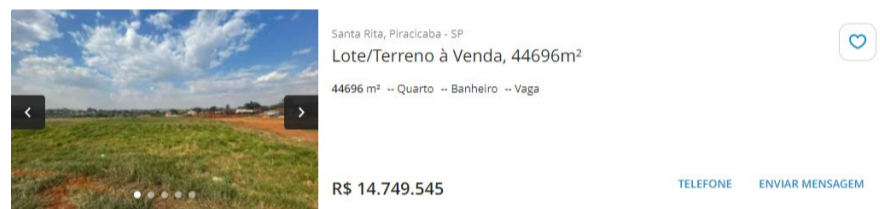
Amostra 01 em 17/12/2024

Os lotes avaliando estão inseridos no Bairro Jardim São Francisco