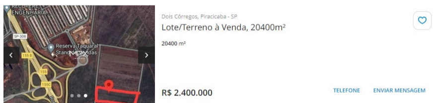
Amostra 04 em 17/12/2024