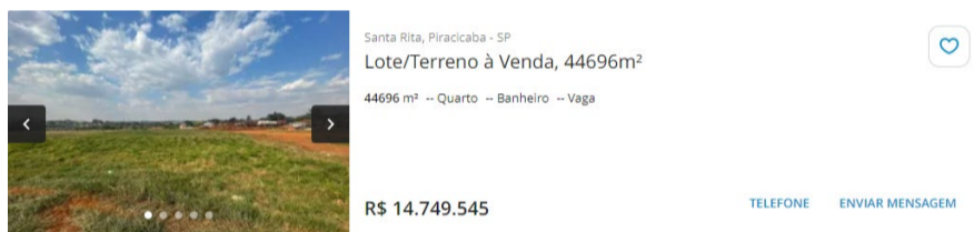
Amostra 01 em 17/12/2024

Os lotes avaliando estão inseridos no Bairro Jardim São Francisco