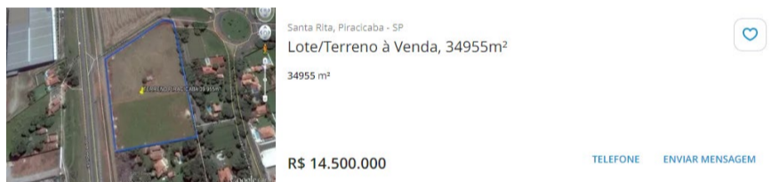
Amostra 02 em 17/12/2024