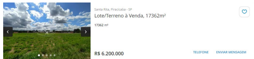
Amostra 03 em 17/12/2024