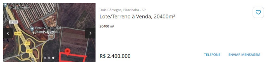
Amostra 04 em 17/12/2024