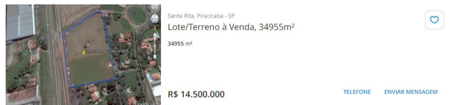
Amostra 02 em 17/12/2024