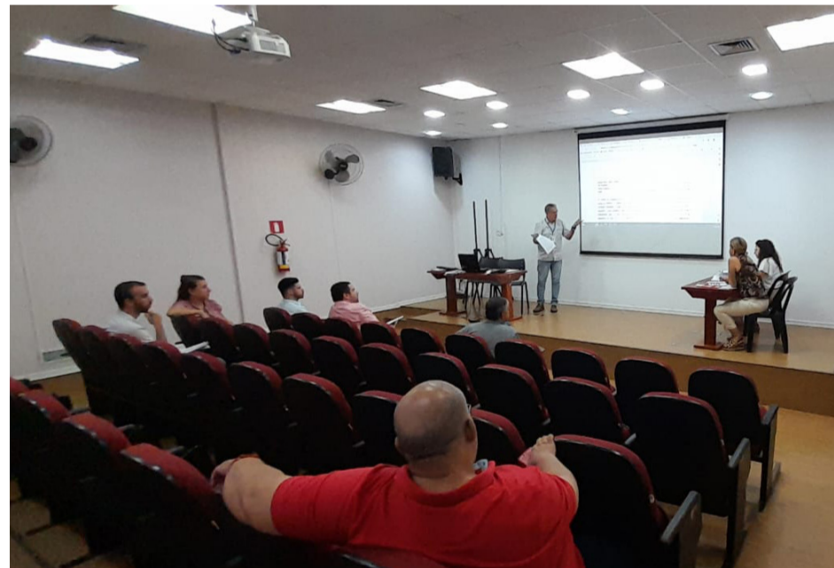
Figura 1: Apresentação do Relatório Demonstrações Contábeis/Financeiras do Terceiro Quadrimestre – Balancete EMDHAP de 2022 aos Membros do Conselho Fiscal da EMDHAP.