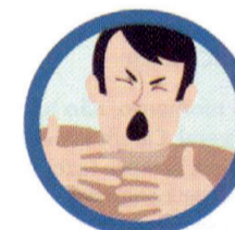
DIFICULDADE PARA RESPIRAR

Além disso, outros sintomas como cansaço, dores, corrimento e congestão nasal, dor de garganta e diarreia podem ocorrer.