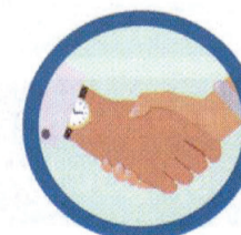
CONTATO FÍSICO COM PESSOA INFECTADA