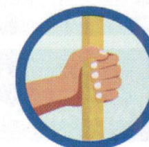
CONTATO COM SUPERFÍCIES CONTAMINADAS

Seguido de contato com boca, nariz e olhos.