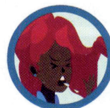
GOTÍCULAS DE SALIVA