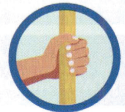
CONTATO COM SUPERFÍCIES CONTAMINADAS

Seguido de contato com boca, nariz e olhos.