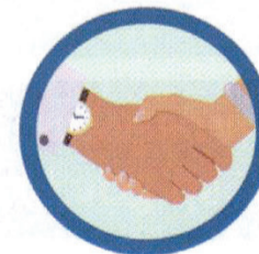
CONTATO FÍSICO COM PESSOA INFECTADA