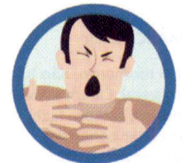
DIFICULDADE PARA RESPIRAR

Além disso, outros sintomas como cansaço, dores, corrimento e congestão nasal, dor de garganta e diarreia podem ocorrer.