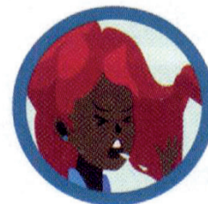
GOTÍCULAS DE SALIVA