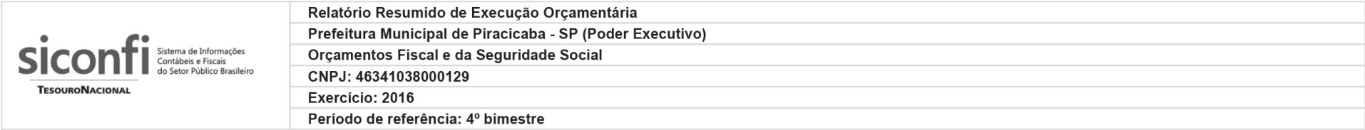
RREO-Anexo 01 | Tabela 1.0 - Balanço Orçamentário