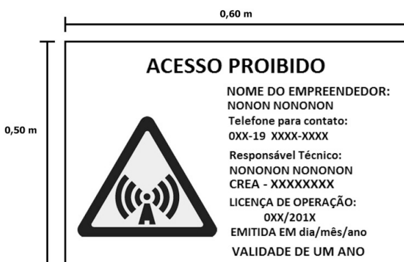
Figura 1: Placa de Sinalização: Conforme art. 31, §1º, da Lei nº 6.814/10 e do art. 3º, deste Decreto.